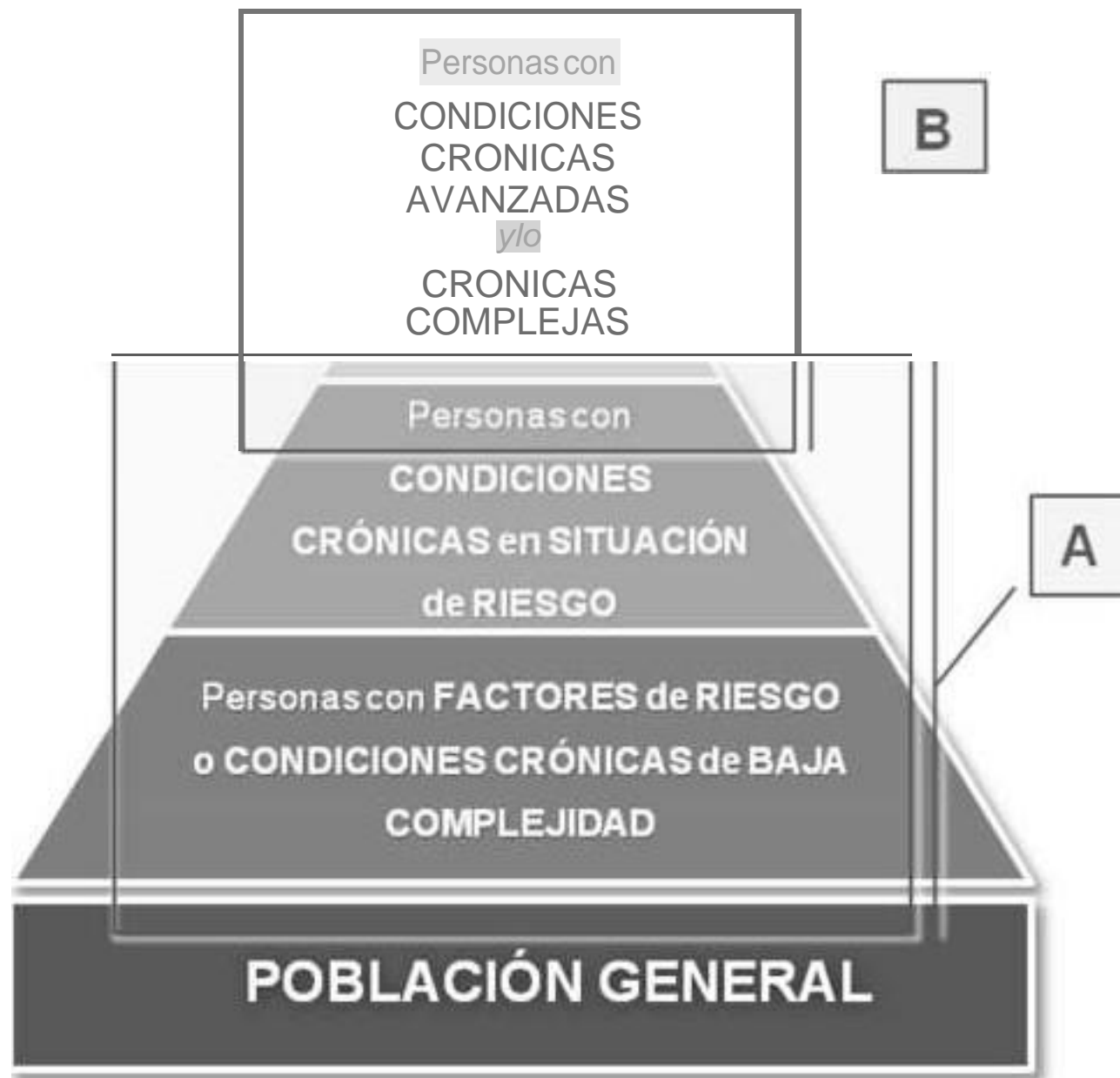
Figura 1 Click here to do""loaj high resolution image