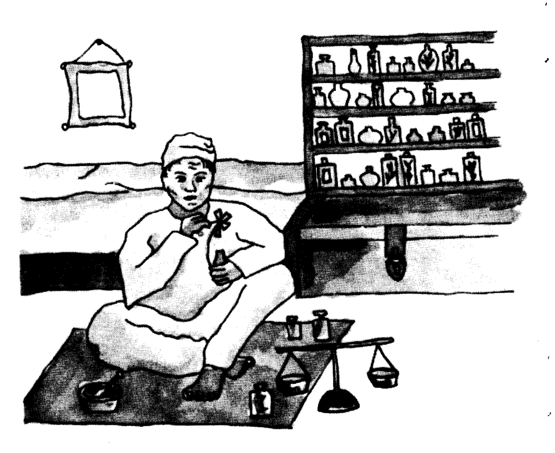
तर नै चोखाइल। हमन एकदम पीर परल।

एकदिन म्वार छाई हमार घरक लग्घु रलक मातृशिशु क्लिनिकम जँचाए जाओ कलकओर्से जँचाए गैली।